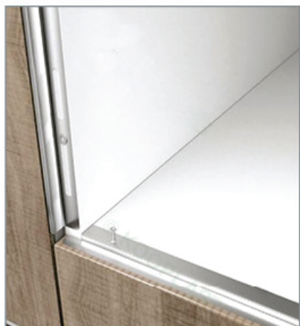
Umístění boční ochranné lišty MT/bocni (levá strana, pohled shora)